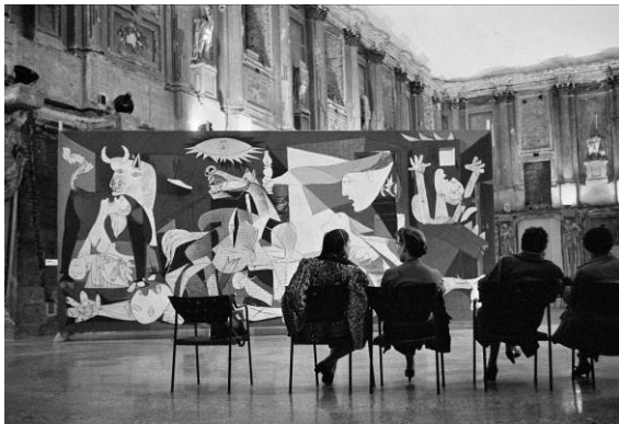
Foto de la sala del Guernica .

Los distintos espacios y recursos expositivos de la muestra descubren el contexto histórico de la época, así como las claves para entender la importancia y el significado del Guernica . La exposición incluye audiovisuales, reproducciones fotográficas y de carteles de la época, y facsímiles de documentos y dibujos que pretenden explicar la historia de la creación y los viajes de una de las obras más representativas del artista más importante del siglo xx.