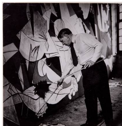
Dora Maar. Picasso de pie trabajando en el Guernica en su taller de Grands-Augustins.

Picasso. El viaje del Guernica propone un recorrido histórico de la obra de Picasso desde su creación en París en 1937 hasta su emplazamiento permanente en el Museo Nacional Centro de Arte Reina Sofía, en 1992. Los visitantes podrán descubrir el proceso creativo que llevó a cabo el célebre artista español para realizar su obra, así como su