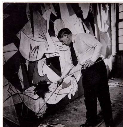
Picasso zutik Guernica lana ontzen Grands-Augustins-eko tailerlean

Picasso. Guernicaren bidaia erakusketak Picassoren lanari buruzko ibilbide historiko bat egiteko aukera dakar, hura Parisen 1937an sortu zenetik 1992an Sofia Erregina Arte Zentroaren Museo Nazionalean behin betiko kokatu zen arte. Horri esker, bisitariak jakingo dute zer-nolako sorkuntza-prozesua gauzatu