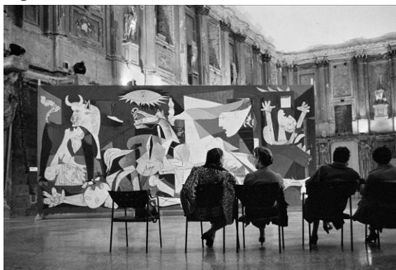
Argazkia: Guernica gela

Picasso . Guernicaren bidai a erakusketa bost esparrutan dago banatua, lanaren ibilbidea haren fase guztietan azaltzeko. Era berean, Picassoren bizitzako une garrantzitsu batzuk erabakigarriak izan ziren Guernica sortzeko, eta horiek ere ageri dira. Gainera, "la Caixa" Gizarte Ekintzak hainbat ikus-entzunezko ekoiztu